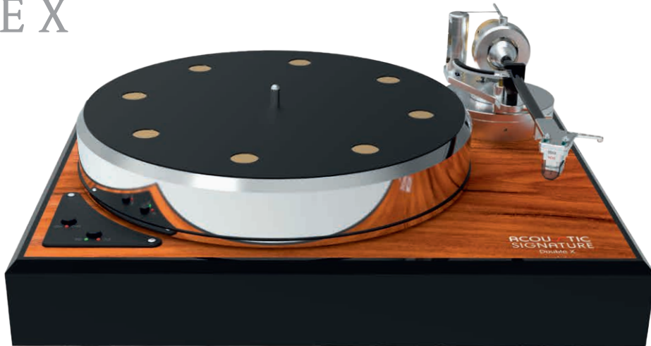
DOUBLE X Palisander