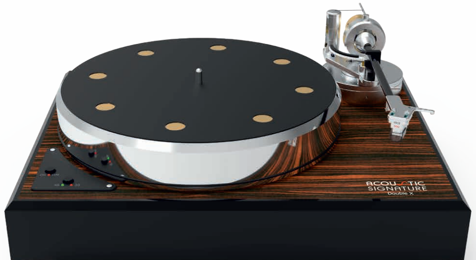
DOUBLE X Makassar

Makassar und Schwarz, Palisander und Schwarz. Klassisches Design wird beim DOUBLE X mit neuester Technik kombiniert. Die Zutaten bestehen aus einem hochpräzisen DC-Motor und einem laufruhigen Teller mit wartungsfreiem Tidorfolon-Lager. Diese Elemente in einem klassischen Gehäuse mit verschiedenen Klavierlack-Oberflächen bringen ein musikalisches Sternegericht auf den Tisch.